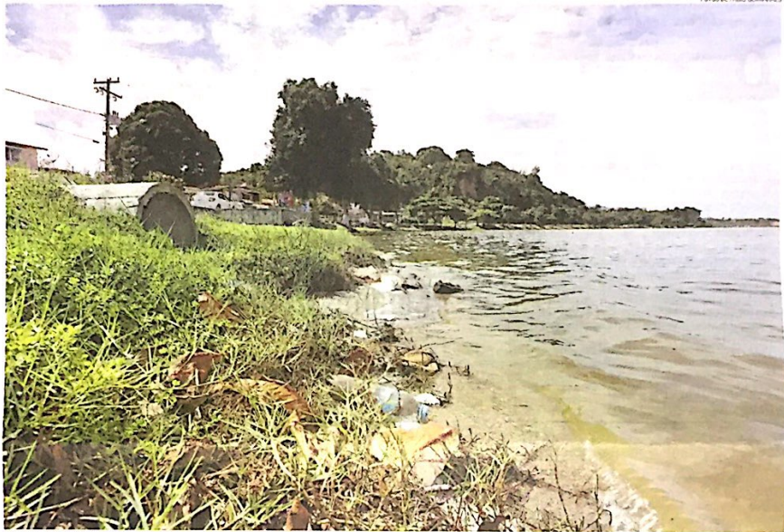
Maricá. A localidade de Jacaré, que abriga uma das lagoas da cidade, sofre com despejo do esgoto e sujeira. Moradores aguardam as melhorias prometidas pela prefeitura