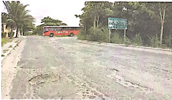
Cabo Frio. Bairro do Peró sofre com buracos nas ruas e falta de sinalização na estrada que liga a cidade a Búzios

construção de duas estações de tratamento de esgoto e de um projeto da barragem para trazer água.